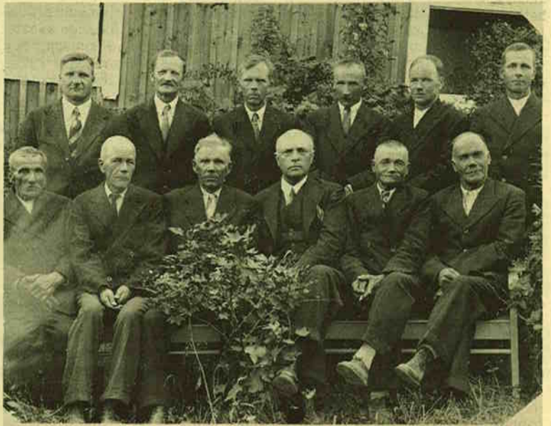
Lumivaaran Yhteismetsän hoitokunta.

Heti sen jälkeen pidettiin kokous Huhtervun kansakoululla touko-